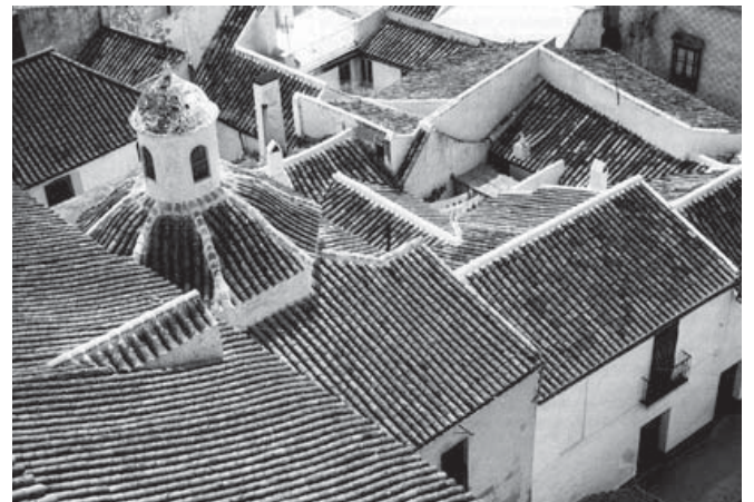
Figura 2. Tejados de Carmona, Sevilla, fotografiados por Bernard Rudofsky en 1963.

En términos generales y en relación a los estilemas disciplinares, se puede afirmar que las fotografías de