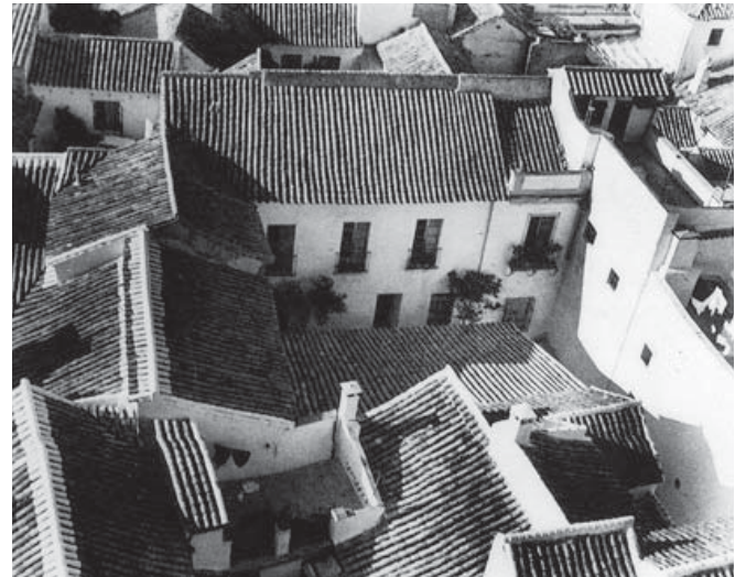
Figura 1. Tejados de Córdoba fotografiados por Enric de Maré.

idea de John Berger de que la fotografía “cita las apariencias pero no las interpreta”. Él confirió justamente a la fotografía no sólo el protagonismo instrumental y enciclopédico de su análisis y metodología investigadora sino la identificación misma con el mensaje interpretativo que quiso transmitir.