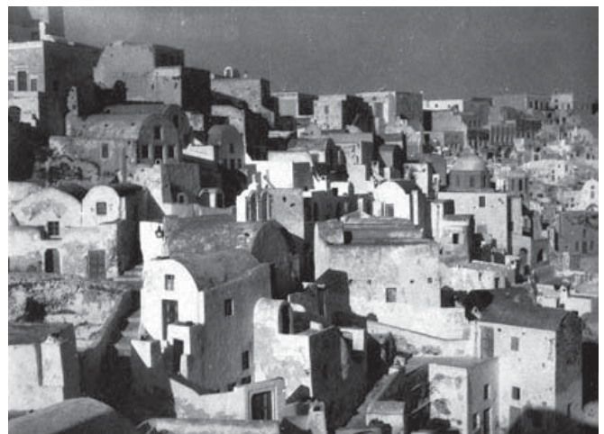
Figura 5. Fotografía de Oia, Santorini. Realizada y publicada por Bernard Rudofsky en su tesis doctoral, 1931.