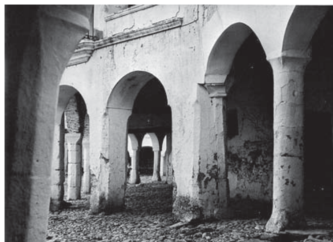
Figura 6. Fotografía de Garrovillas, Cáceres. Bernard Rudofsky, 1963, publicada en Arquitectura sin Arquitectos .