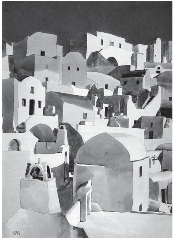
Figura 4. Acuarela de Oia, Santorini. Bernard Rudofsky, 1929.

tar que se volara con el viento. A pesar de dibujar y componer sus láminas con destreza y rigor académico, liberado de prejuicios, idealismos y romanticismos, se abandona en manos del instrumento visual del siglo XX, la máquina fotográfica, para trabajar de forma operativa en ese recuento y captación de lo que observaba en sus viajes.